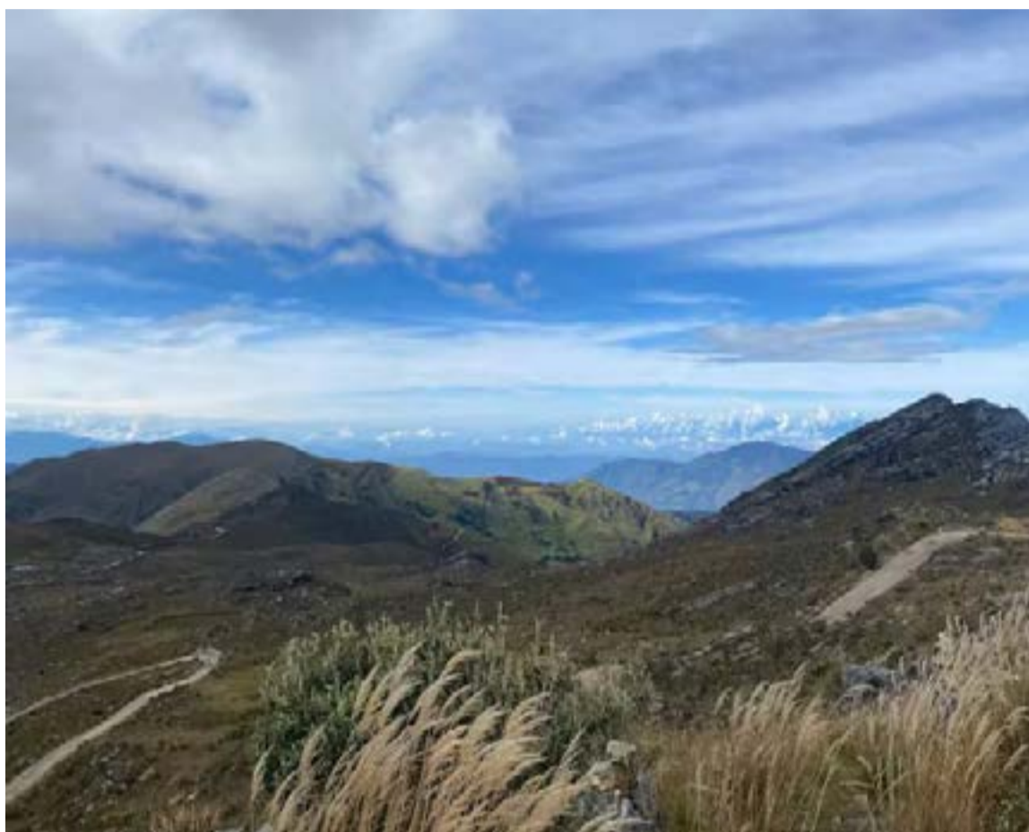
Páramo Almorzadero, Zona de Reserva Temporal de Recursos Naturales Renovables