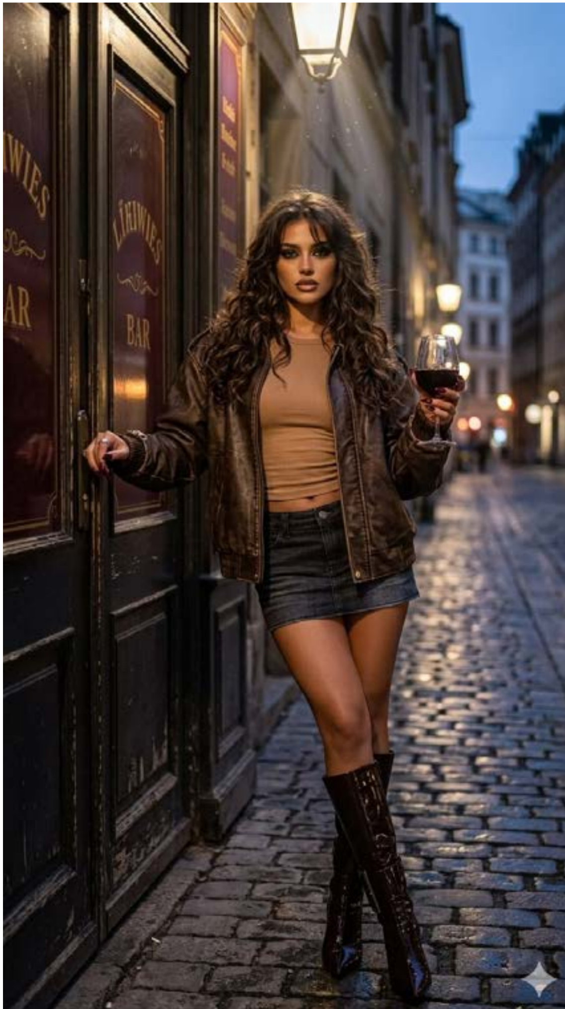
Una Noche de Encanto