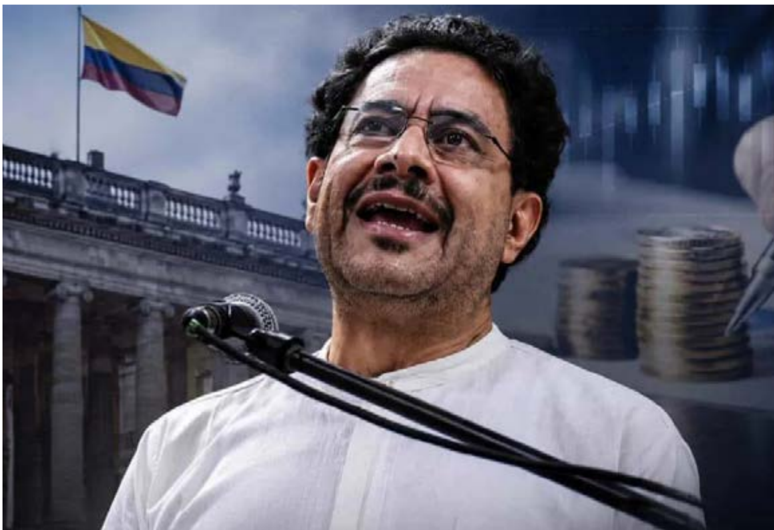
Iván Cepeda Castro, retorna al Senado de la República en representación de la oposición al nuevo gobierno.

Hijo del recordado líder político Manuel Cepeda Vargas —asesinado en 1994 en el marco del genocidio contra la Unión Patriótica—, Iván Cepeda forjó su liderazgo desde las entrañas del movimiento social y la defensa de los derechos humanos. Filósofo de profesión y magíster en Estudios de Desarrollo de la Universidad de Lyon, Francia, dedicó sus primeros años de actividad pública a dirigir el Movimiento Nacional de Víctimas de Crímenes de Estado (Movice).