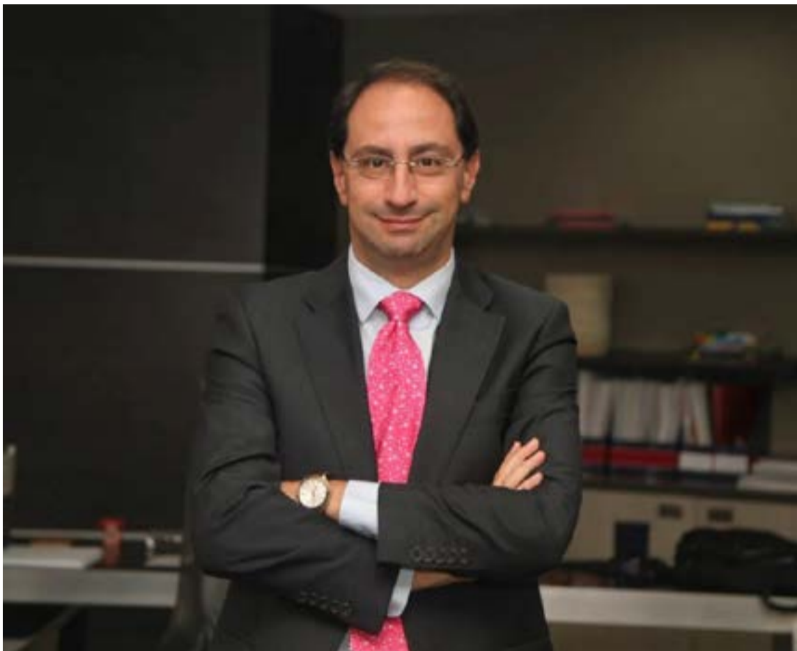
José Manuel Restrepo, vicepresidente de Colombia