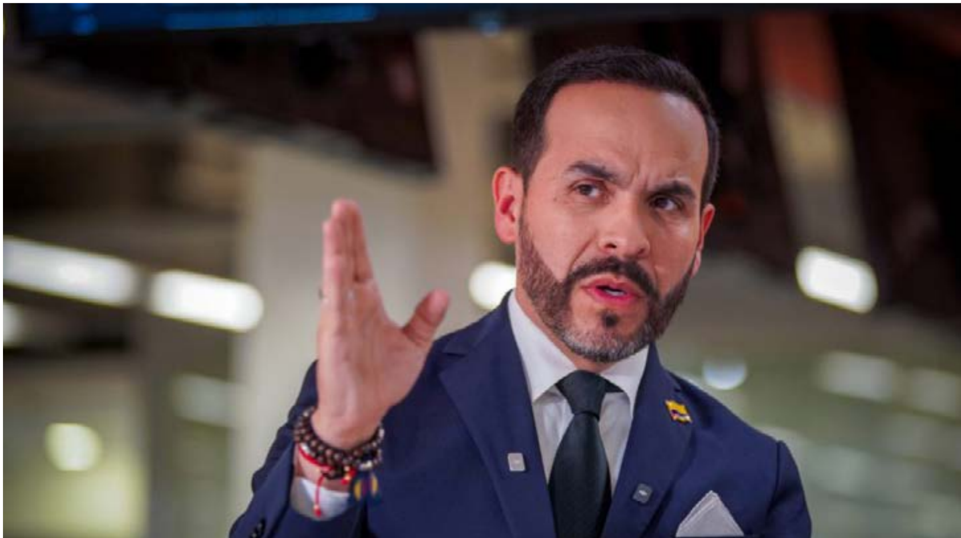
Abelardo de la Espriella, fue elegido presidente de Colombia para el periodo 2026-2030