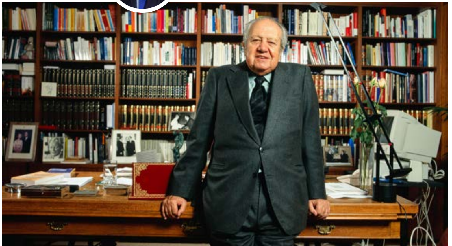
Mário Soares, ex-presidente de Portugal