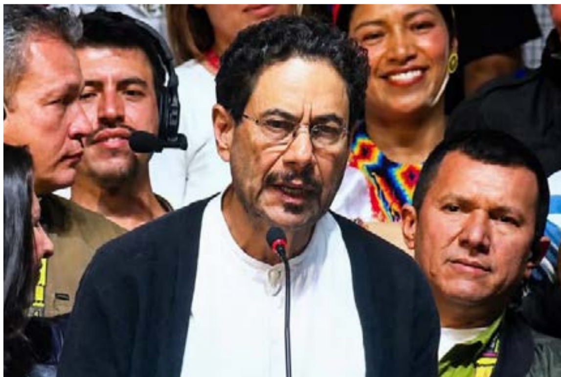
Iván Cepeda Castro, compareció ante los medios junto a su fórmula vicepresidencial, Aída Quilcué, para fijar la posición oficial de la izquierda. Cepeda manifestó que, si bien su campaña reconoce el resultado inicial arrojado por el preconteo de la Registraduría, no se puede hablar de un veredicto definitivo debido al estrecho margen de diferencia entre ambos proyectos.